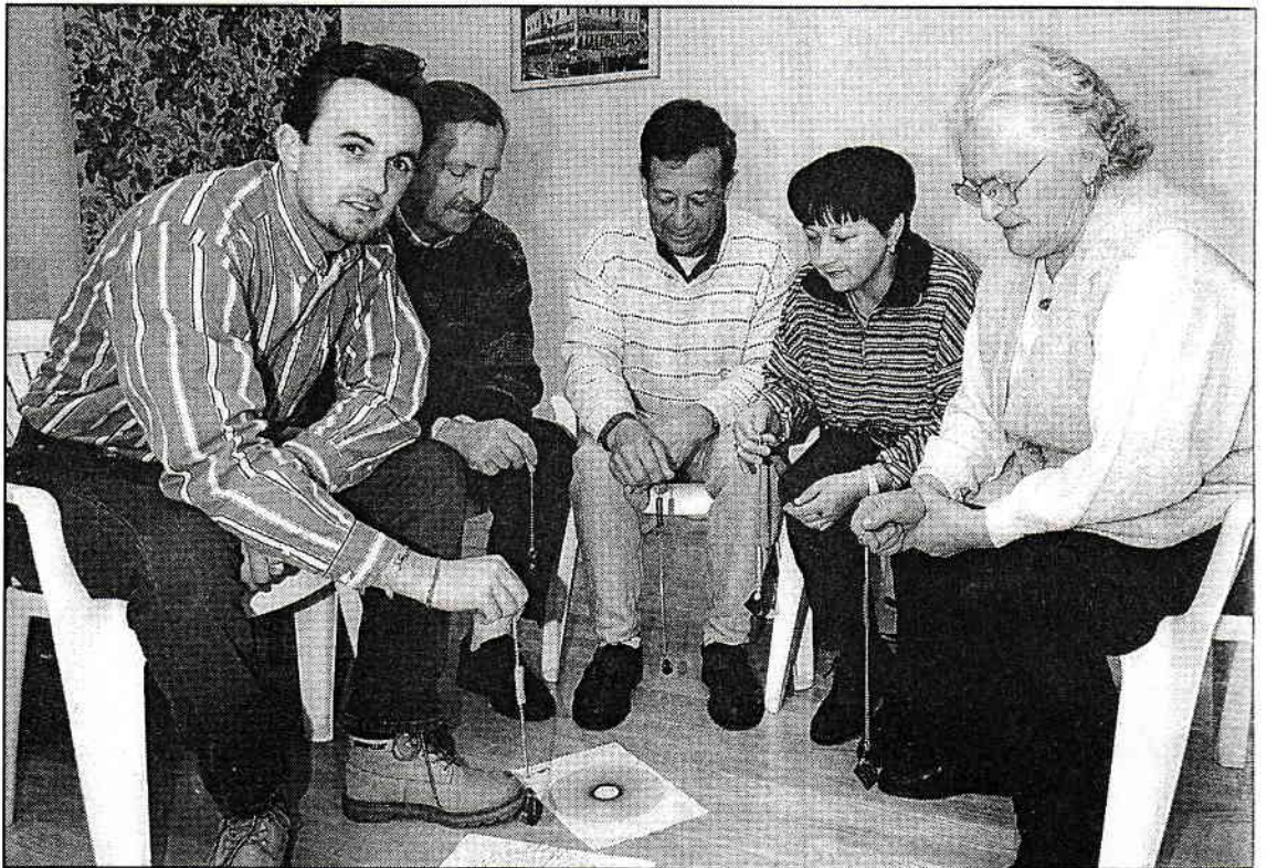
Gemeinsames Pendeln mit dem Ziel, körperliche und seelische Blockaden aufzulösen. Voraussetzungen sind höchste Konzentration sowie ein an einer Kette befestigter Basalt.